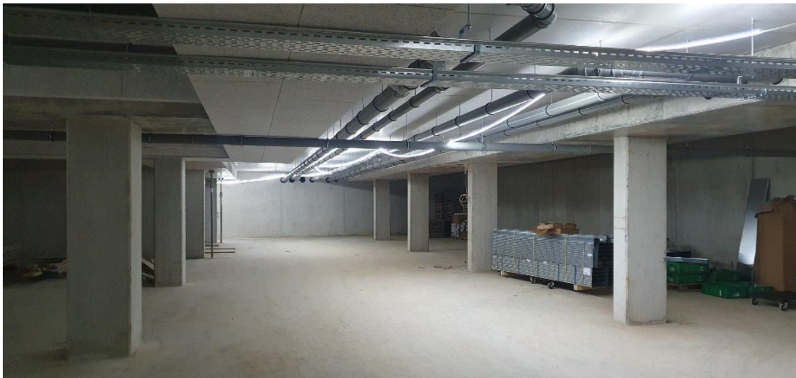
Afbeelding genomen in de parkeergarage, onder gebouw Violet d.d. 26 november 2024

Met het beplanten van de openbare ruimtes rond de gebouwen Orange, Jaune en Vert zal binnenkort gestart worden.