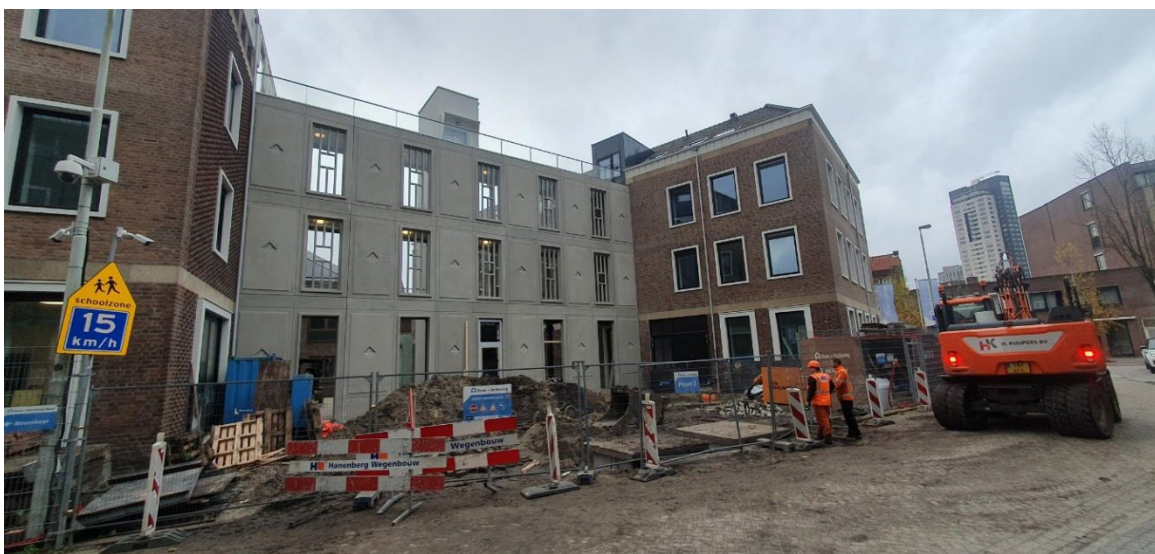
Passerelle gezien vanaf Deken van Somerenstraat d.d. 26 november 2024