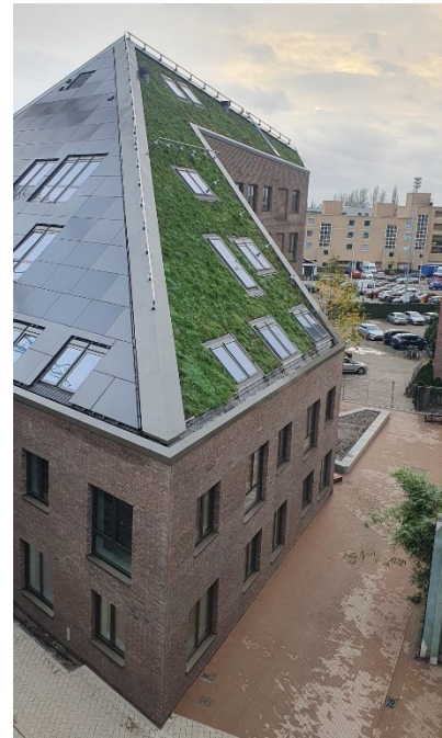
Afbeelding van groene dak d.d. 26 november 2024