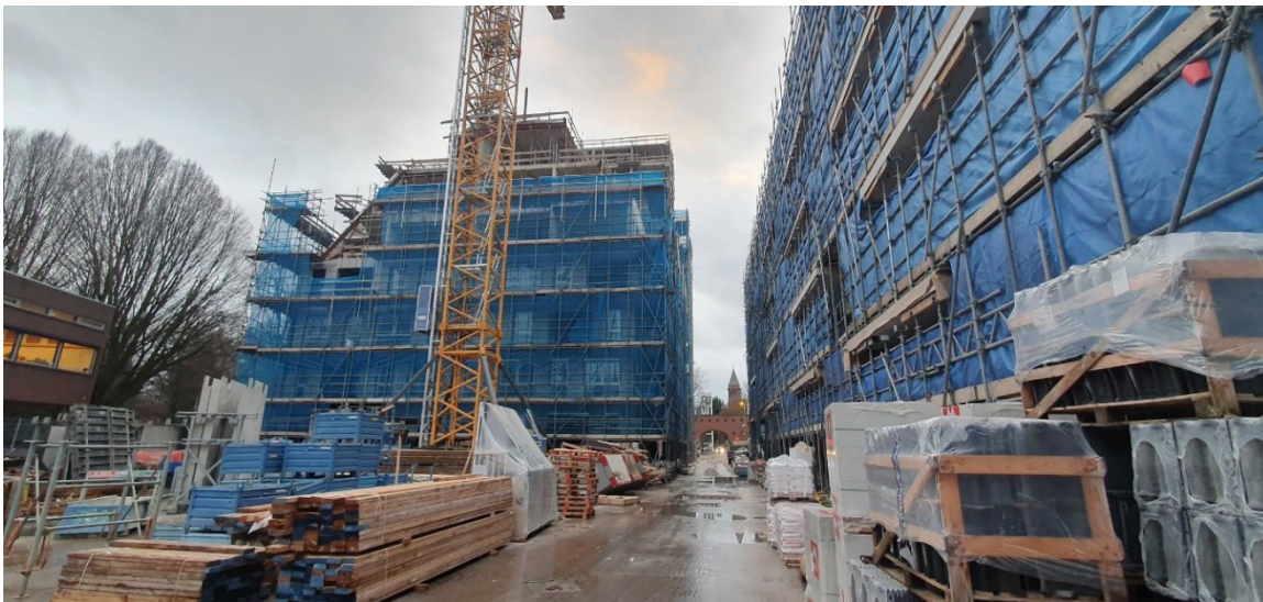
Aanzicht gebouw Violet d.d. 26 november 2024