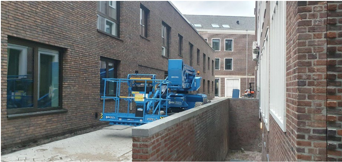
Doorgang tussen gebouw Orange en gebouw Jaune d.d. 27 november 2024