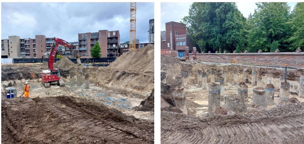
Voor de kelder zijn we begonnen met het uitgraven van de beide kraanpoeren en het snellen van de palen.

Inmiddels zijn de funderingspalen van de kelder gereed. Tot aan de bouwvakantie (week 31, 32, 33) wordt er gestart met het ontgraven van de put voor de kraanpoeren (soort betonnen platform). Deze kraanpoeren kunnen dan nog voor de vakantie gestort worden. De poeren worden geïntegreerd in de fundering van de kelder, circa 5,5 meter diep. Deze werkzaamheden zullen de komende weken voor meer bouwverkeer zorgen.